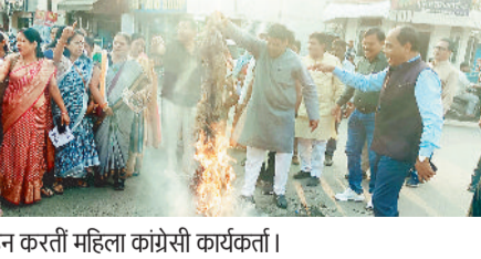
पुतला दहन करती महिला कांग्रेस कार्यकर्ता।