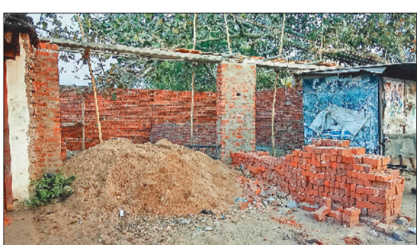
अतिक्रमण कर किया जा रहा निर्माण कार्य।

तहसीलदार न्यायालय के स्थगन के बाद भी लच्छीबंध तालाब को पाटकर निर्माण किया जाना बंद नहीं जारी है। प्रशासन का ध्यान आकर्षण कराते हुए आदेश का उल्लंघन करने वालों पर कार्यवाही की मांग की गई है। लच्छीबंध तालाब को बचाने का संघर्ष को डेढ़ दशक से भी ज्यादा हो रहा है। करीब 17 वर्ष पूर्व लच्छीबंध तालाब घाट में बने हाते की कुछ दीवाल को तोड़े जाने के बाद राखड़ डालकर तालाब को पाटने की खबर से लोग आंदोलित हो उठे थे। धरना प्रदर्शन के बीच तत्कालीन तहसील