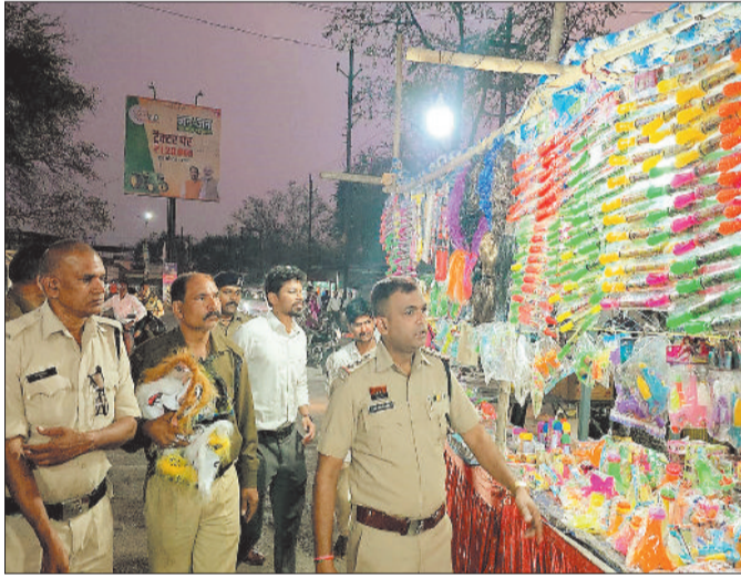
मुखौटा जब करने की कार्रवाई पुलिस के अफसर।

होली में हुड़दंग रोकने और शांति व्यवस्था बनाए रखने पुलिस प्रशासन ने कमर ली है। सुरक्षा व्यवस्था के मद्देनजर इस बार ड्रोन से हाईटेक तरीके से विशेष निगरानी की जाएगी। जापानी तकनीक वाले 3 ड्रोन से संवेदनशील एवं भीड़भाड़ वाले क्षेत्रों पर लगातार नजर रखी जाएगी। रंगों के पर्व होली की खुमारी अब छाने लगी है। मंगलवार 3 मार्च को होलिका दहन किया जाएगा। वहीं कुछ स्थानों पर 2 मार्च को भी होलिका दहन किया गया। बुधवार 4 मार्च को रंग गुलाल लकाकर होली खेली जाएगी। होली की खुमारी में कई जगह पर अप्रिय स्थिति भी निर्मित हो जाती है। होली में हुड़दंग रोकने पुलिस प्रशासन ने कमर कस ली है। होली पर्व की सुरक्षा व्यवस्था को ध्यान में रखते हुए जिले में ड्रोन तकनीक के माध्यम से विशेष निगरानी की जाएगी हाईटेक तरीके से जापानी तकनीक वाले 3 ड्रोन से संवेदनशील क्षेत्र में नजर रखी जाएगी। त्योहार के दौरान शांति एवं कानून व्यवस्था बनाए रखने हेतु संवेदनशील एवं भीड़भाड़ वाले क्षेत्रों पर लगातार नजर रखी जाएगी। ड्रोन के माध्यम से प्रमुख चौक-चौराहों एवं बाजार क्षेत्रों की निगरानी की जाएगी। भीड़भाड़ वाले स्थानों पर संदिग्ध गतिविधियों पर सतर्क दृष्टि रखी जाएगी। संकीर्ण गलियों एवं ऐसे क्षेत्रों में निगरानी की जाएगी जहां पुलिस बल का सीधे पहुंच पाना कठिन होता है। ट्रैफिक