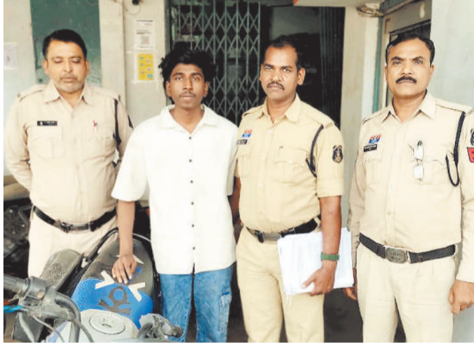
पुलिस गिरफ्त में आरोपी।

गिरफ्तार किया है। पकड़े गए आरोपियों ने चोरी करने के बाद हिल स्टेशन व देश की राजधानी जा पहुंचे थे जहां आरोपियों ने चोरी के पैसे से जमकर गुलछर्रे उड़ाए हैं। पुलिस ने मामले में आरोपियों को गिरफ्तार कर सलाखों के पीछे भेज दिया है।