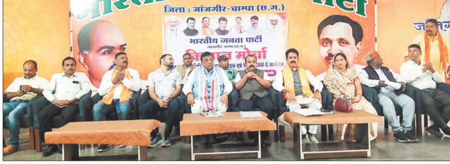
बैठक में मंचस्थ अतिथिगण।