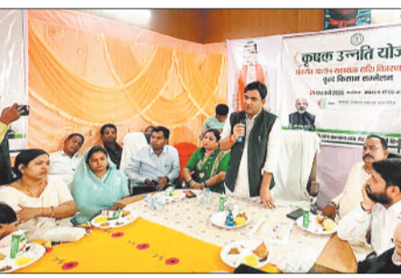
कार्यक्रम में उपस्थित किसानों को संबोधित करते जिला पंचायत उपाध्यक्ष।

जनपद पंचायत बहन्नीडीह के सभागार में कृषक उन्नति योजना के तहत आदान सहायता राशि वितरण समारोह एवं किसान सम्मेलन का आयोजन हुआ। इस अवसर पर किसानों के हितों