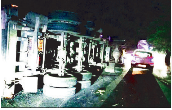
दुर्घटनाग्रस्त ट्रेलर वाहन।