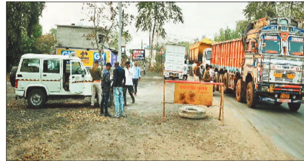
वाहनों की जांच करती पुलिस टीम।

होली त्योहार को शांतिपूर्ण और सुरक्षित माहौल में संपन्न करने के उद्देश्य से बम्हनीडीह पुलिस ने क्षेत्र में सघन वाहन जांच अभियान शुरू किया है। मुख्य चौक-चौराहों पर विशेष निगरानी रखते हुए ट्रिंक ड्राइव, नाबालिग वाहन चालकों और गाड़ियों के दस्तावेजों की गहन जांच की जा रही है। होली के दौरान किसी भी प्रकार की दुर्घटना या अव्यवस्था को रोकने और आमजन को सुरक्षित वातावरण प्रदान करने के उद्देश्य से पुलिस द्वारा विशेष अभियान